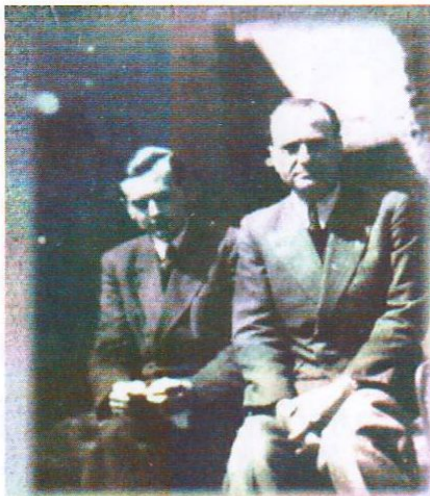
Személyes találkozásuk és barátságuk 1933-ban, 8 évvel a Sorsunk létrejötte előtt kezdődött.